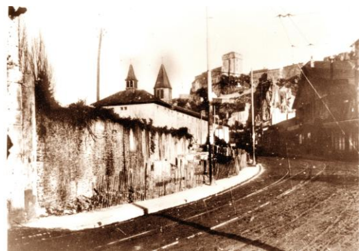
le Monastère des Clarisses de Lourdes en 1904